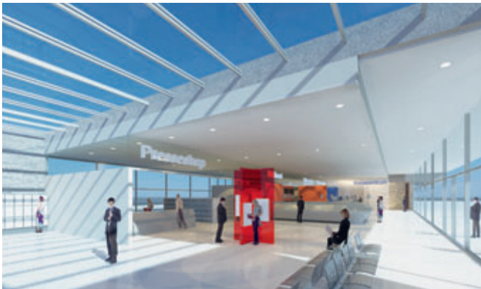
Grüner Bahnhof – Innenansicht