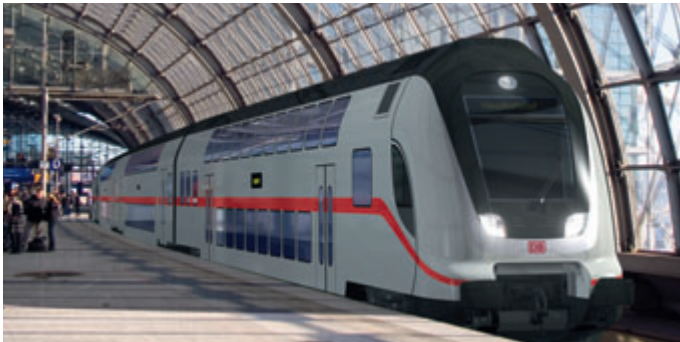
Neuer IC-Doppelstock (ab Ende 2013)

Qualität hat Priorität – bei der Modernisierung der Fernverkehrsflotte setzt die Bahn ihre Qualitätsoffensive konsequent fort. Ab 2012 sollen die ersten von 16 neuen ICE 3-Zügen zum Einsatz kommen. Der bis zu 320 Kilometer pro Stunde schnelle Hochgeschwindigkeitszug der Deutschen Bahn hat sich als rollendes Büro für Geschäftsreisende bewährt. Hoher Sitzkomfort, Tische und Laptop-Steckdosen sowie Zugbereiche mit Internetzugang und verbessertem Handy-Empfang sorgen für optimale Arbeitsbedingungen.